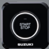
PANEL DE ARRANQUE PRINCIPAL

Para panel de Sistema de Arranque Sin Llave - "Keyless Start System"