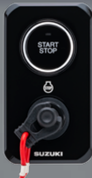
PANEL DE ARRANQUE PRINCIPAL VERTICAL