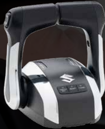
MANDO DE CONSOLA DOBLE