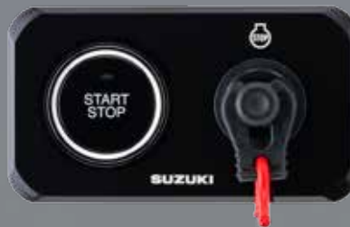
PANEL DE ARRANQUE PRINCIPAL HORIZONTAL