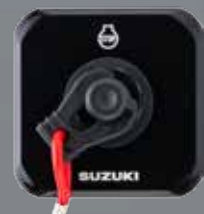
PANEL DE INTERRUPTOR EMERGENCIA