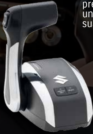
MANDO DE CONSOLA INDIVIDUAL

Obtenga la mejor experiencia de navegación, con el nuevo sistema Control de Precisión Suzuki de tecnología "Drive-by-wire". Controla hasta 6 motores, presenta nuevos diseños más elegantes, aportando una mayor comodidad al usuario y funcionamiento suave.